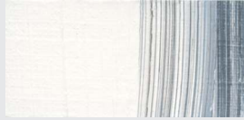
808 Titanweiß *** Titanium White Blanc de titane