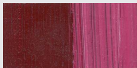
866 Krapplack dunkel ** Madder Lake deep Rouge de garance