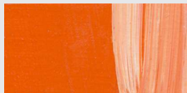
829 Kadmiumorange *** Cadmium Orange Orange de cadmium