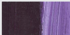
927 Kobaltviolett dunkel *** Cobalt Violet deep Violet de cobalt foncé