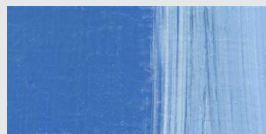
938 Himmelblau *** Sky Blue Bleu de ciel