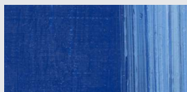
923 Kobaltblau hell *** Cobalt Blue light Bleu de cobalt clair