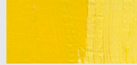
826 Kadmiumgelb hell ** Cadmium Yellow light Jaune de cadm. claire