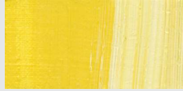
810 Primaire-Gelb *** Primary Yellow Jaune primaire