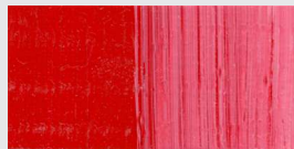
874 Kadmiumrot dunkel *** Cadmium Red deep Rouge de cadm. foncé