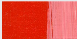
872 Kadmiumrot hell *** Cadmium Red light Rouge de cadm. clair