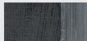
982 Elfenbeinschwarz *** Ivory Black Noir ivoire