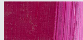
850 Primaire-Rot *** Primary Red Rouge primaire